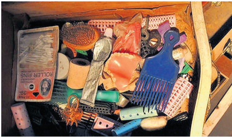
Persönlicher Krimskrams: Diese Schublade stammt aus New Orleans.

Finden die Leute das nicht komisch, dass jetzt jeder ihre Sachen ansehen kann? „Nein, die meisten waren froh, dass dadurch Leute auf der ganzen Welt von dem Hurrikan erfahren“, sagt die Künstlerin. Genauso wichtig sind